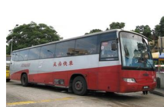
小銭に両替してからドライバー渡し of Causeway Link